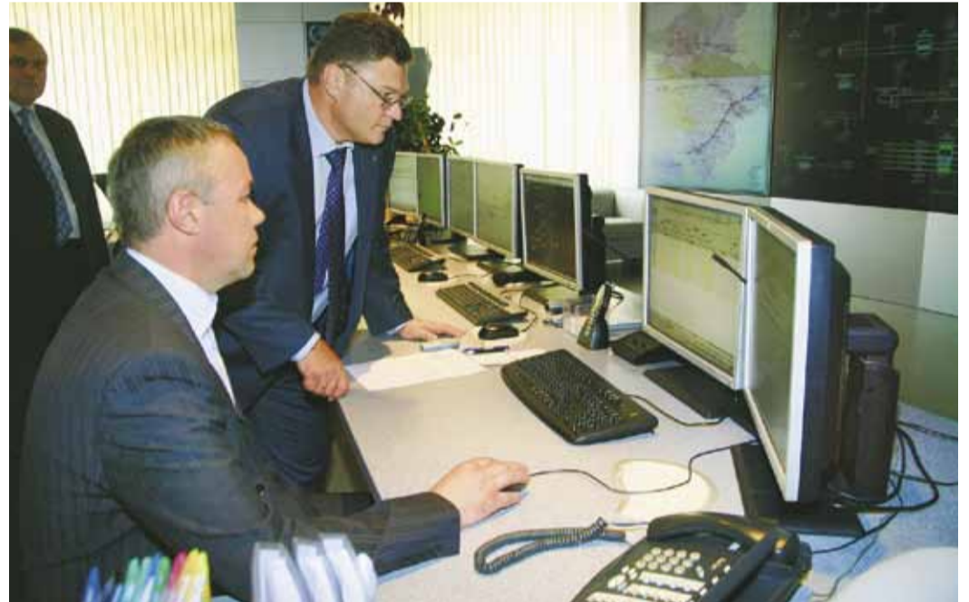
В диспетчерской предприятия

– Газпром сегодня – это предприятие с большими традициями. Место в нашей компании не красит человека, а «делает» его. «Чужой» здесь не выживет, вокруг только ответственные люди, болеющие за дело. Мы принимаем на работу специалистов разного уровня – и обладателей «красного» диплома, и «середиачков». Бывает, что обладатель «красного» диплома уходит от нас на следующий день, а «середиачок» оказывается хорошим технарем,