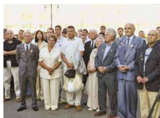
Ветераны общества на митинге, посвященном 50-летию газопровода «Серпухов – Ленинград», август 2009 г.

ФСП. Практически все ее авторы – участники ветеранского фонда Общества. Книга рассказывает о людях, трудом которых закладывался фундамент предприятия. Все это подтверждает одну непреложную истину – созданный шесть лет назад фонд необходим, он и далее должен работать в интересах наших ветеранов.