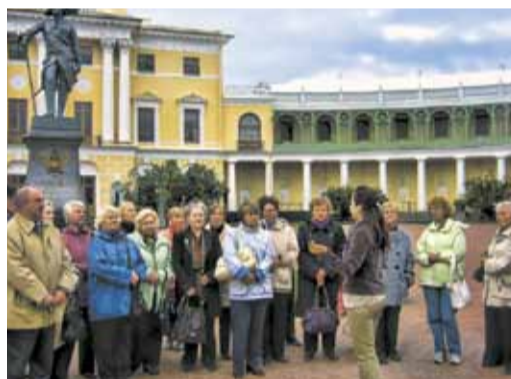
Экскурсия ветеранов аппарата управления в Павловский дворец, сентябрь 2009 г.

До недавнего времени мы участвовали в организации работы по контролю исполнения Коллективного договора в части, касающейся пенсионеров и разработке – внесению предложений в Коллективный договор. Опыт работы нашего фонда показал, что пенсионеры занимают достойную нишу в коллективе Общества, а руководители компании и филиалов с большим вниманием относятся к проблемам и просьбам ветеранов.