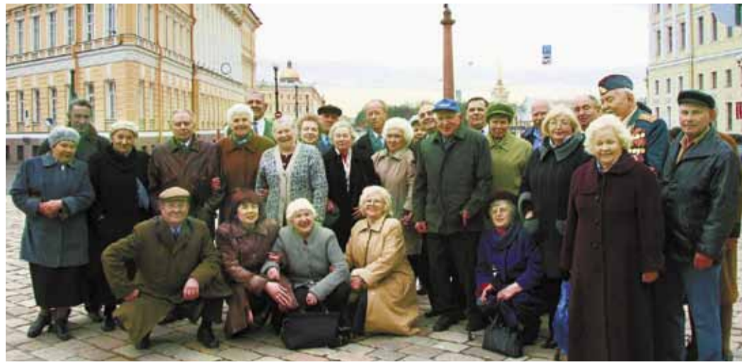
Ветераны Великой Отечественной в год 60-летия Великой Победы на Дворцовой площади в Санкт-Петербурге

Но, пожалуй, наиболее важна работа, связан-