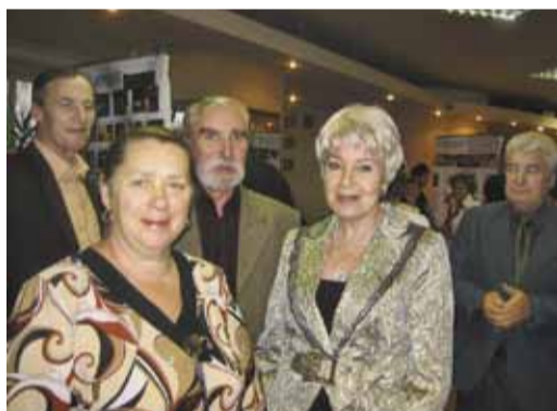
Члены ФСП на концерте в Валдайском Доме культуры, 2008 г.

численна группа ветеранов – участников ввода в эксплуатацию газопровода «Серпухов – Ленинград» и «Белоусово – Ленинград». Продолжают работать и уходят на заслуженный отдых работники газопровода «Валдай – Псков – Рига», «Торжок – Минск – Ивацевичи» (первой, второй и третьей очереди), газопровода «Череповец – Ленинград». Перед многими ветеранами, а также готовящимися уходить на пенсию тогда вставал вопрос: а что дальше? Как продолжить общение между собой и трудовым коллективом, в котором прошли многие годы?