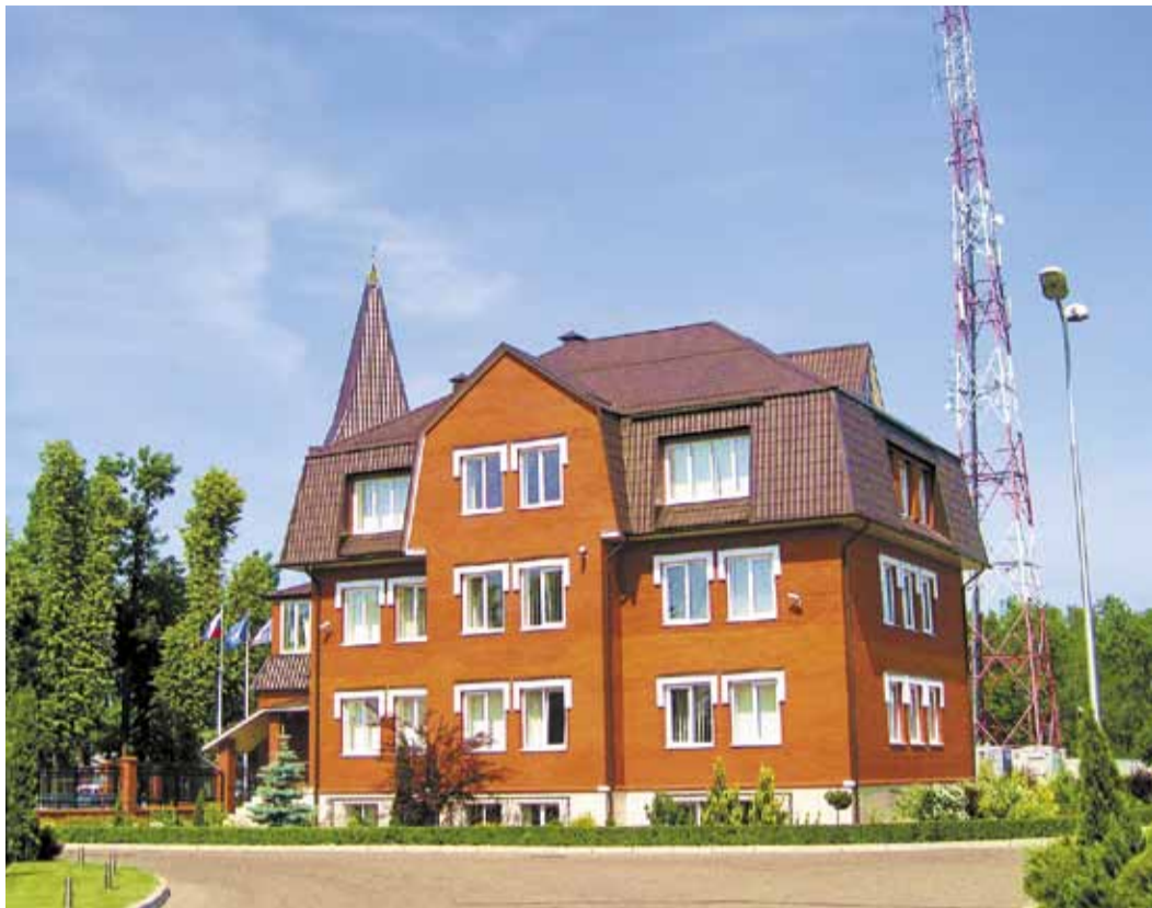
Административное здание Калининградского ЛПУМГ