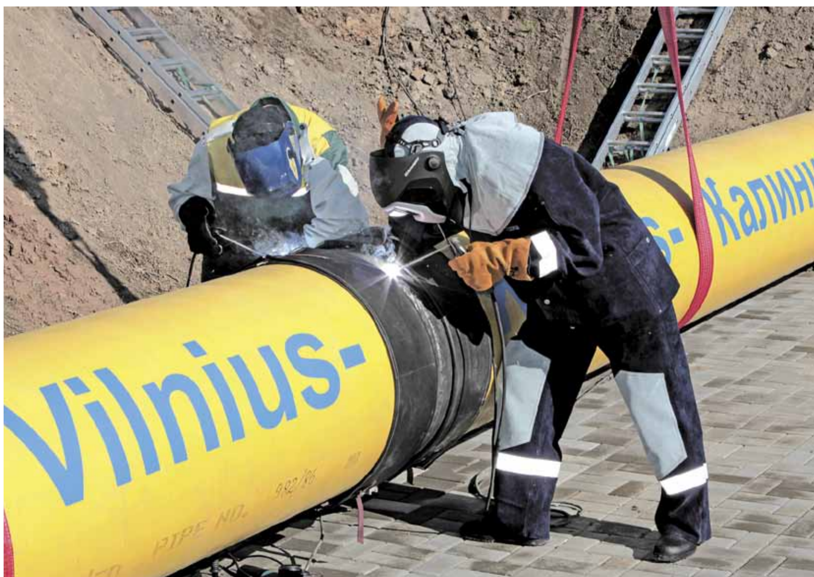
Сварка «красного стыка» газопровода «Минск – Вильнюс – Каунас – Калининград». 9 сентября 2009 г.

– увеличение мощностей КС «Краснознаменская» для обеспечения гарантированной подачи планируемых объемов газа по газопроводу «Минск – Вильнюс – Каунас – Калининград».