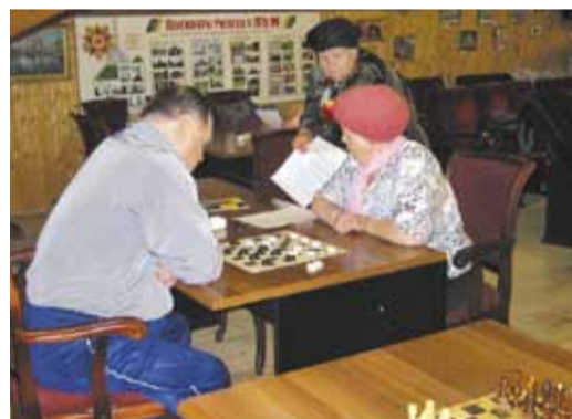
Ветераны на базе отдыха «Голубой факел», октябрь 2009 г.

Шесть лет постоянной кропотливой работы – что удалось сделать за это время, каковы основные направления деятельности и куда расходуются денежные средства фонда?