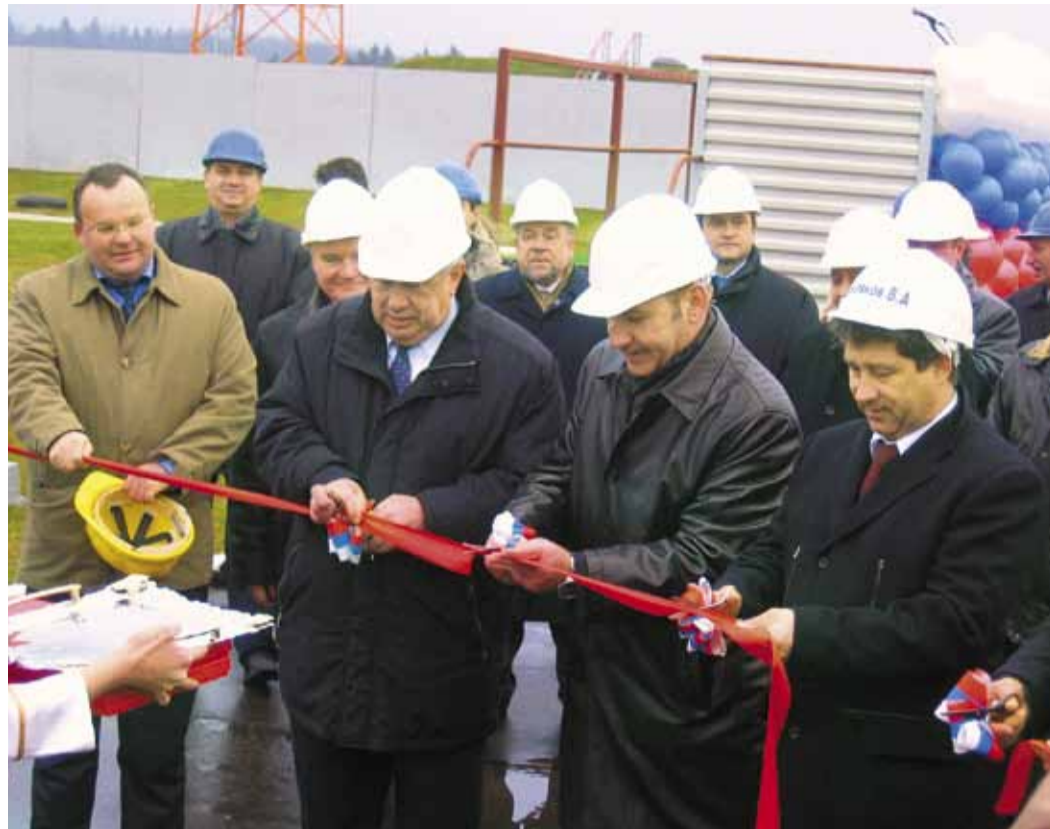
Открытие КС «Краснознаменская» после реконструкции. 2009 г.