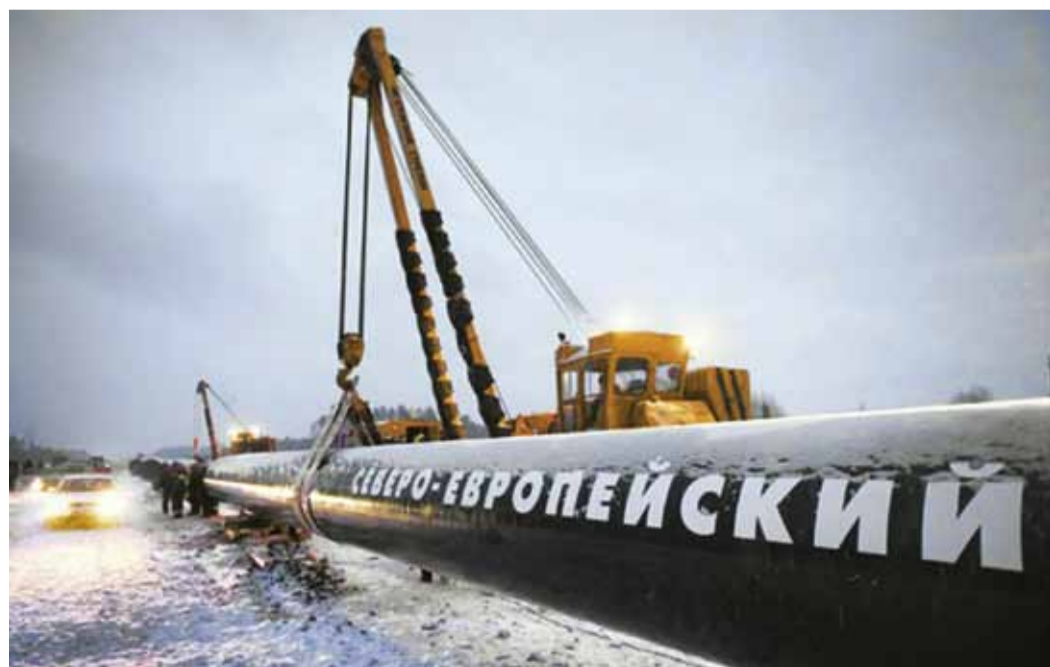
Строительство магистрального газопровода «Грязовец – Выборг» идет по плану

В уходящем году выполнены все планы по капитальному ремонту. Проведены замена и переизоляция примерно 170 км газопроводов. Полностью закончена переизоляция трех компрессорных станций. Проведена серьезная работа по КС «Изборск». Выполняется програм-